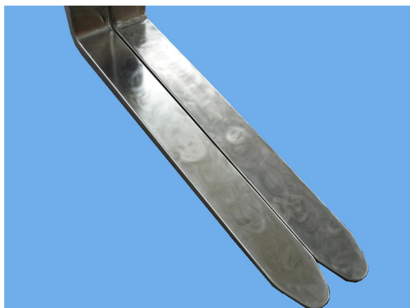
coppia di forche rivestite INOX